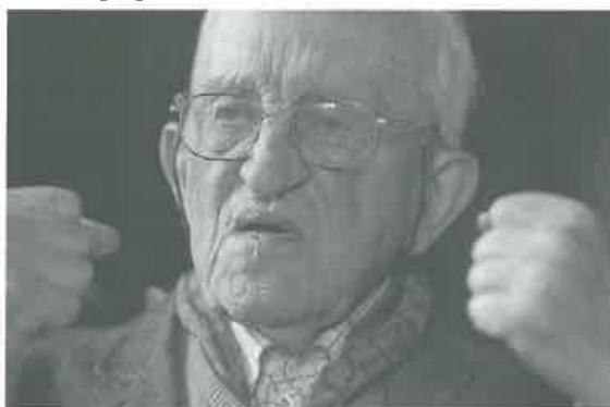
Entretien réalisé le 23 octobre 2002 par François Rouillay avec la participation de Didier Fahnauer.