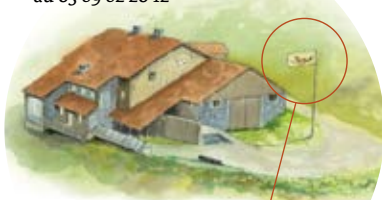
Le drapeau levé signale l'ouverture du bâtiment.

OUVERTURE de 10h à 18h tous les jours en juillet - août & tous les week-ends du 15 mai au 30 juin et du 1 er sept. au 15 oct. En dehors de cette période, téléphonez au 03 89 82 20 12