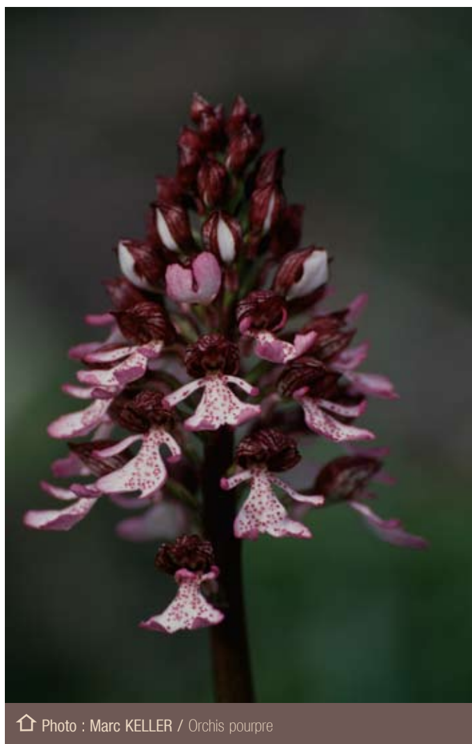
Orchis pourpre

Il est nécessaire d'homogénéiser cette politique entre le Haut-Rhin et le Bas-Rhin afin que l'ensemble des collines sèches alsaciennes trouve un statut de protection cohérent.