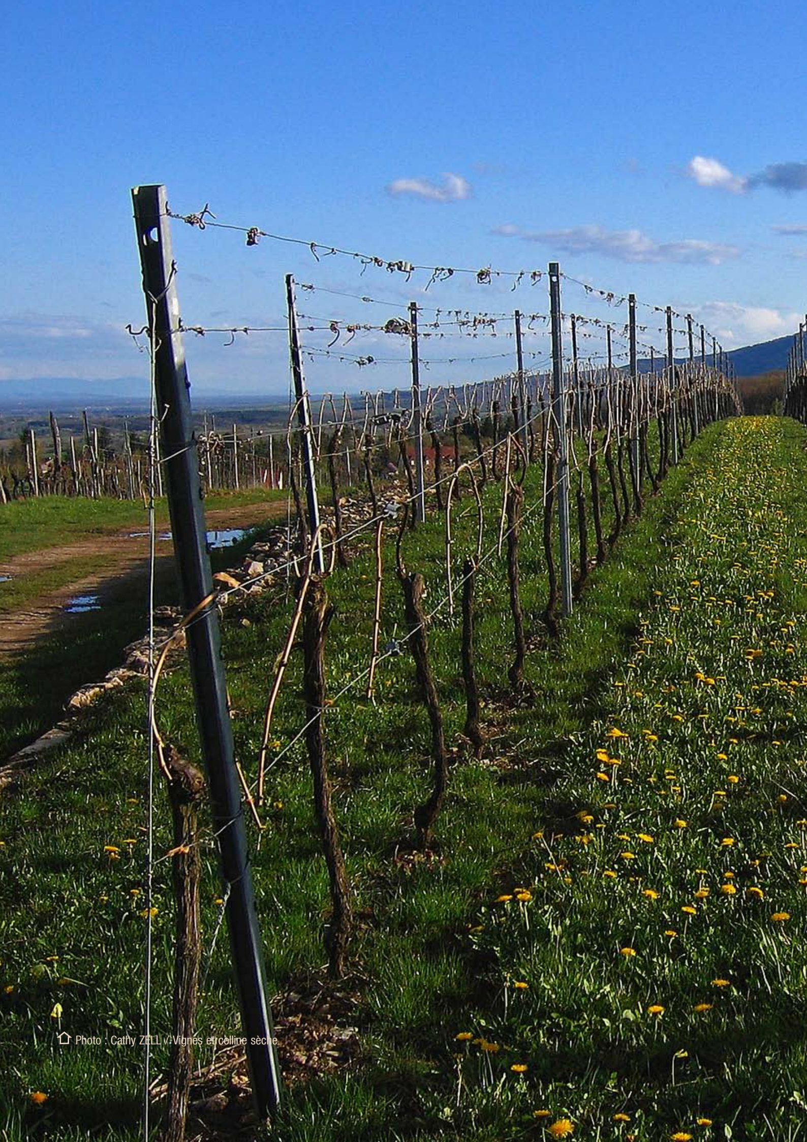
Vignes et colline sèche