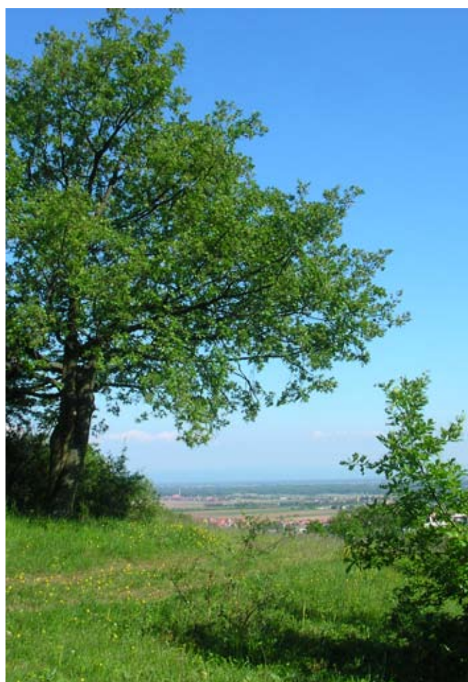
Immerschenberg

on peut encore citer, dans le Bas-Rhin, le Gloekelsberg et le Kochersberg.