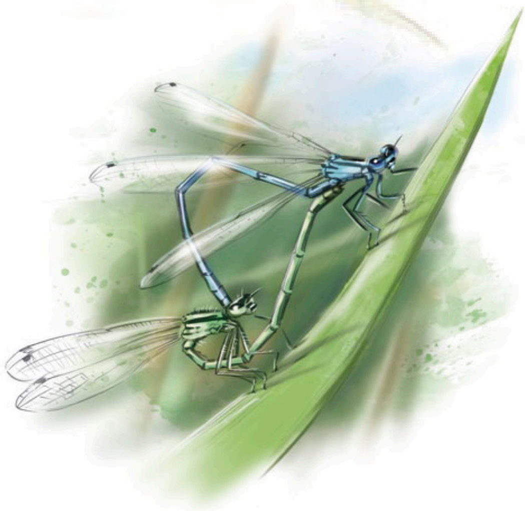
Illustration - Caroline Koehly