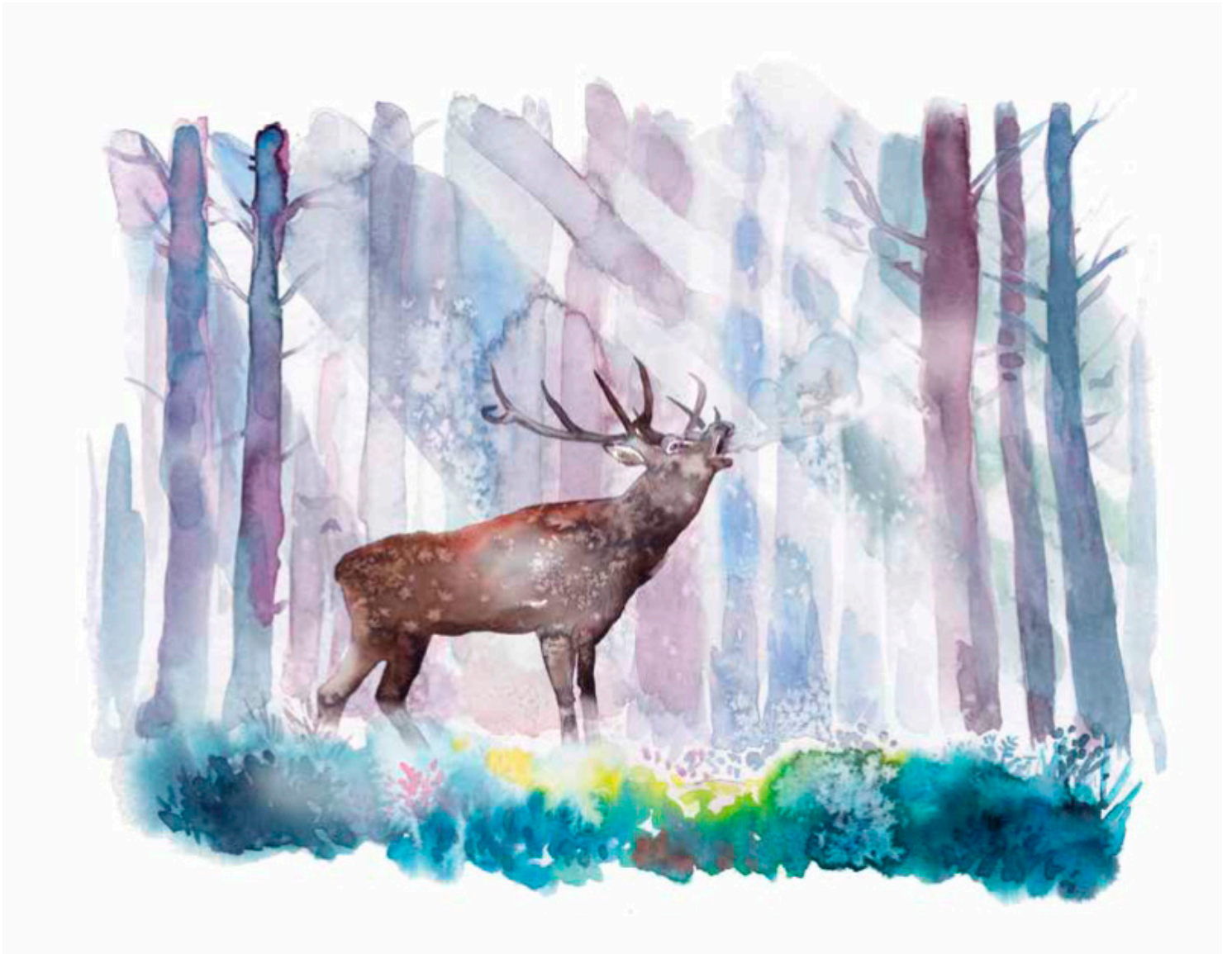
illustration : Fanny Delqué