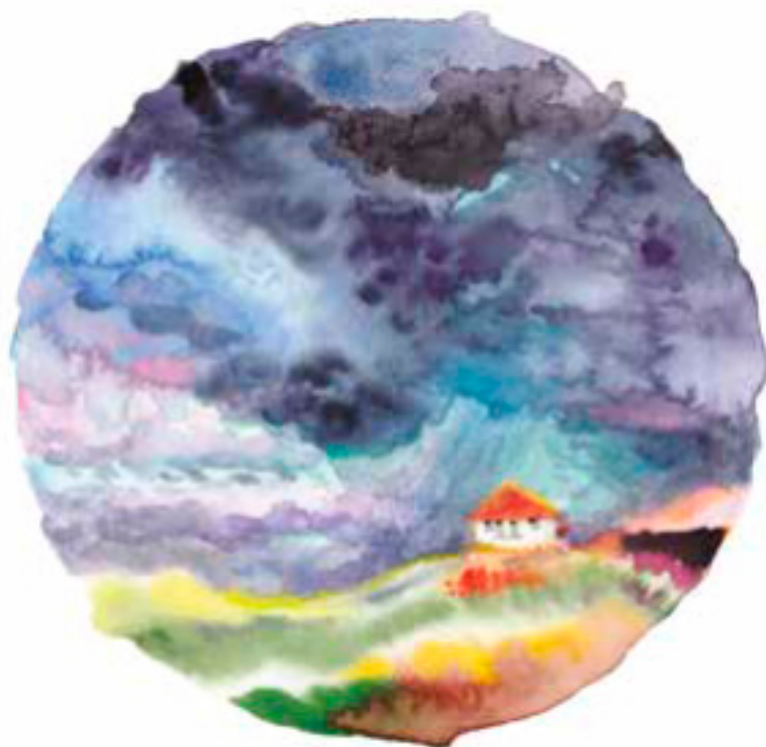
illustration : Fanny Delqué

Extrait du livre « Alsace Nature à livre ouvert » page 54