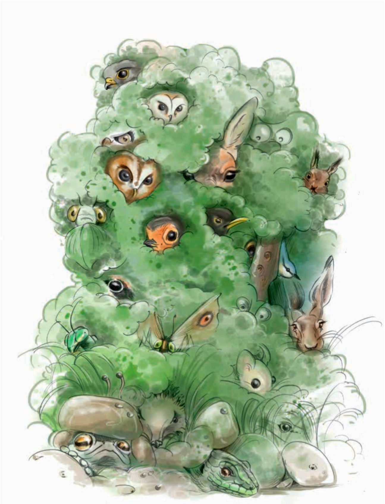
Illustration - Caroline Koehly