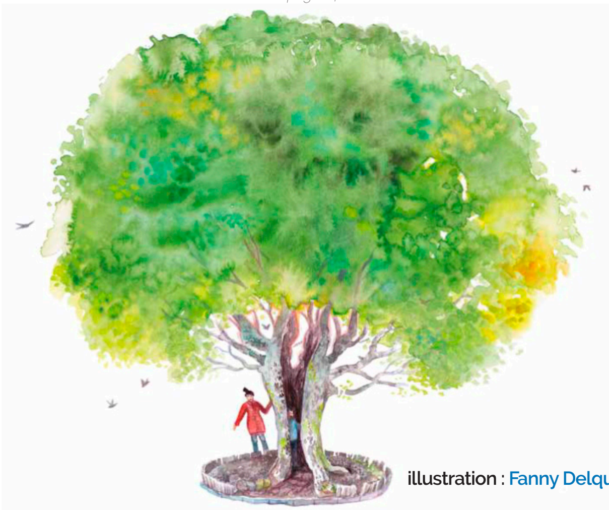
illustration : Fanny Delqué

Extrait du livre « Alsace Nature à livre ouvert » page 84-86