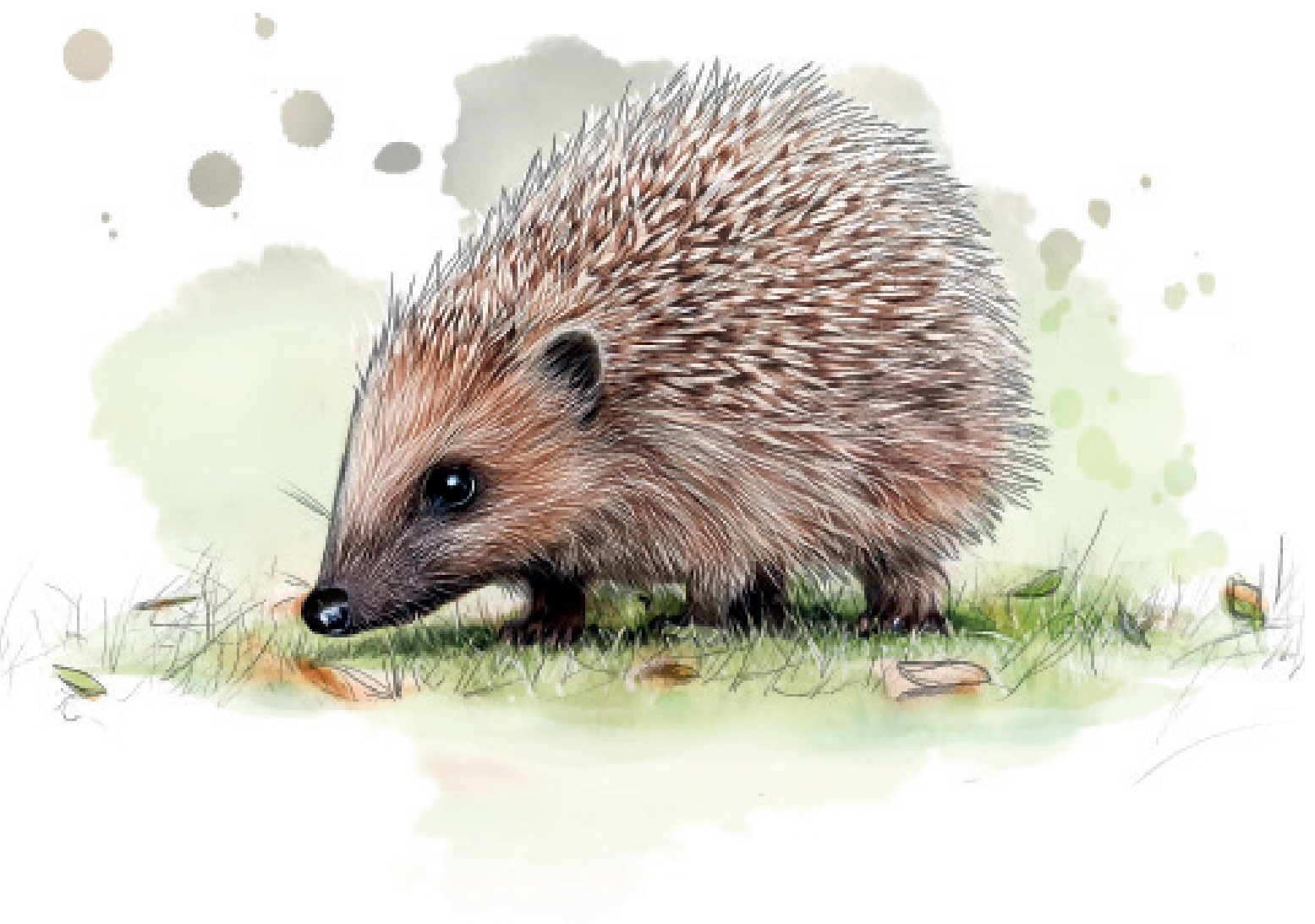
Illustration - Vincent Coudeyre D-Graph